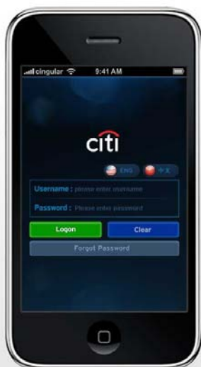
圖二：Citibank iPhone 應用程式登入頁面