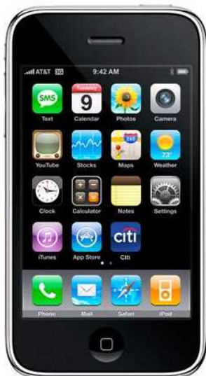
圖一：Citibank 隨身銀行服務應用程式可裝置於 iPhone 主介面